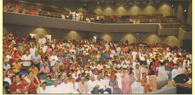
શ્રદ્ધામય ભાવિકોની હર્ષોલ્લાસ ઉપસ્થિતિ