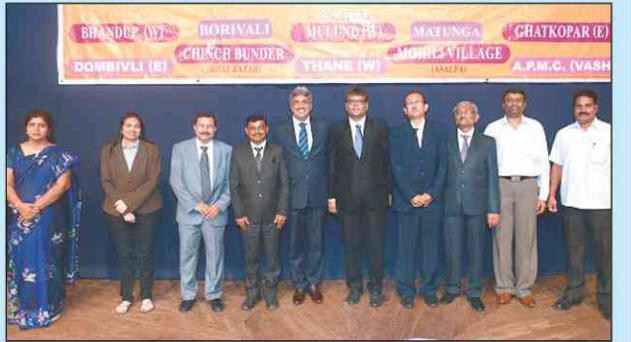
ડાયરેક્ટર્સ અને અધિકારી વર્ગ