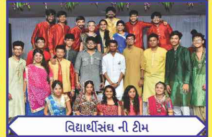
વિદ્યાર્થીસંઘ ની ટીમ