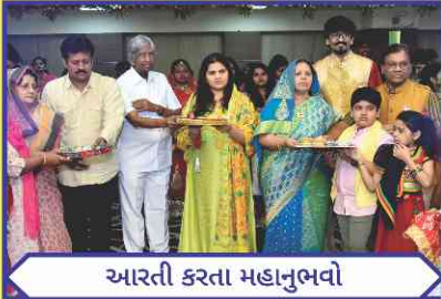
આરતી કરતા મહાનુભવો